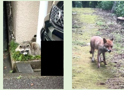
アライグマやキツネなど

アライグマが住宅地(2丁目)に出没しました。アライグマをはじめキツネなどの野生動物の目撃情報がちょこちょこ寄せられています。三田谷公園など近隣の山に生息しているものと思われます。見かけたら手を触れず、実害がある場合は市役所などに連絡をしましょう。