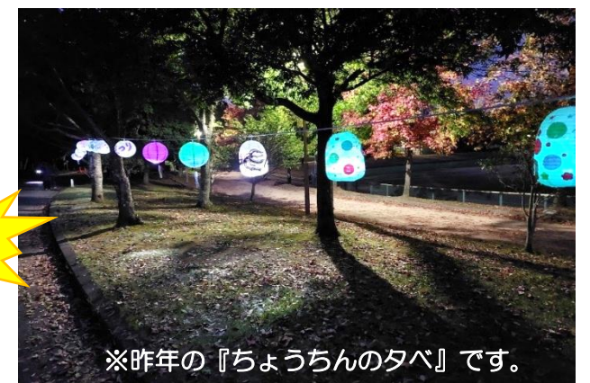
※昨年の『ちょうちんの夕べ』です。

令和四年度 武庫小校区まち協定期総会開催 令和四年度の定期総会は5月22日に開催。提案された全ての議案について承認または可決されましたことをご報告いたします。詳しくはまち協ホームページに掲載していますのでご確認ください。(武庫小校区まち協)で検索ください)