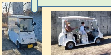
写真は昨年のものです。